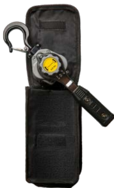
0,25 - 0,5 ton