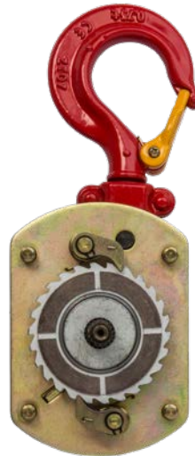
Extrem langlebige Bremsscheibe mit aufgesinterten Bremsbelägen