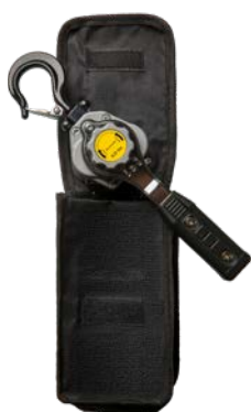
0,25 - 0,5 ton