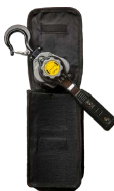
250kg - 500kg