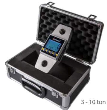
3 - 10 ton