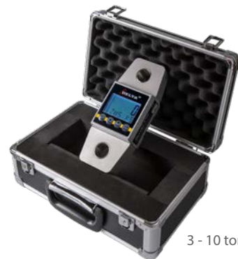
3 - 10 ton